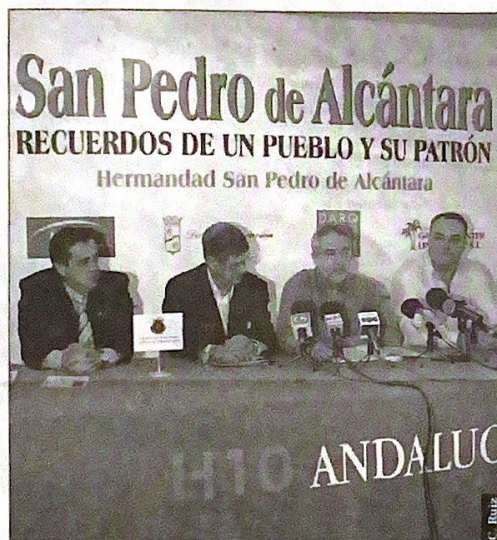
Presentación del libro ante los medios de comunicación.