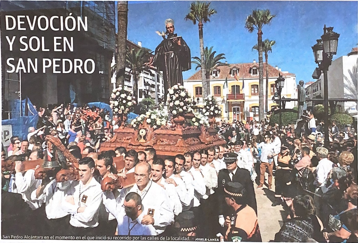
San Pedro Alcántara en el momento en el que inició su recorrido por las calles de la localidad. JOSE LANZA